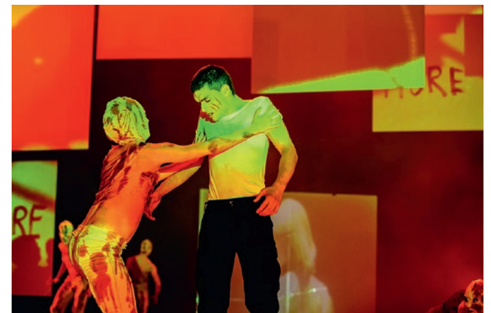
„Othello“ Ballett von Ralf Dörnen frei nach Shakespeare

Sa 06.11. / 19.30 Uhr Greifswald: Großes Haus Fr 17.12. / 19.30 Uhr Stralsund: Großes Haus