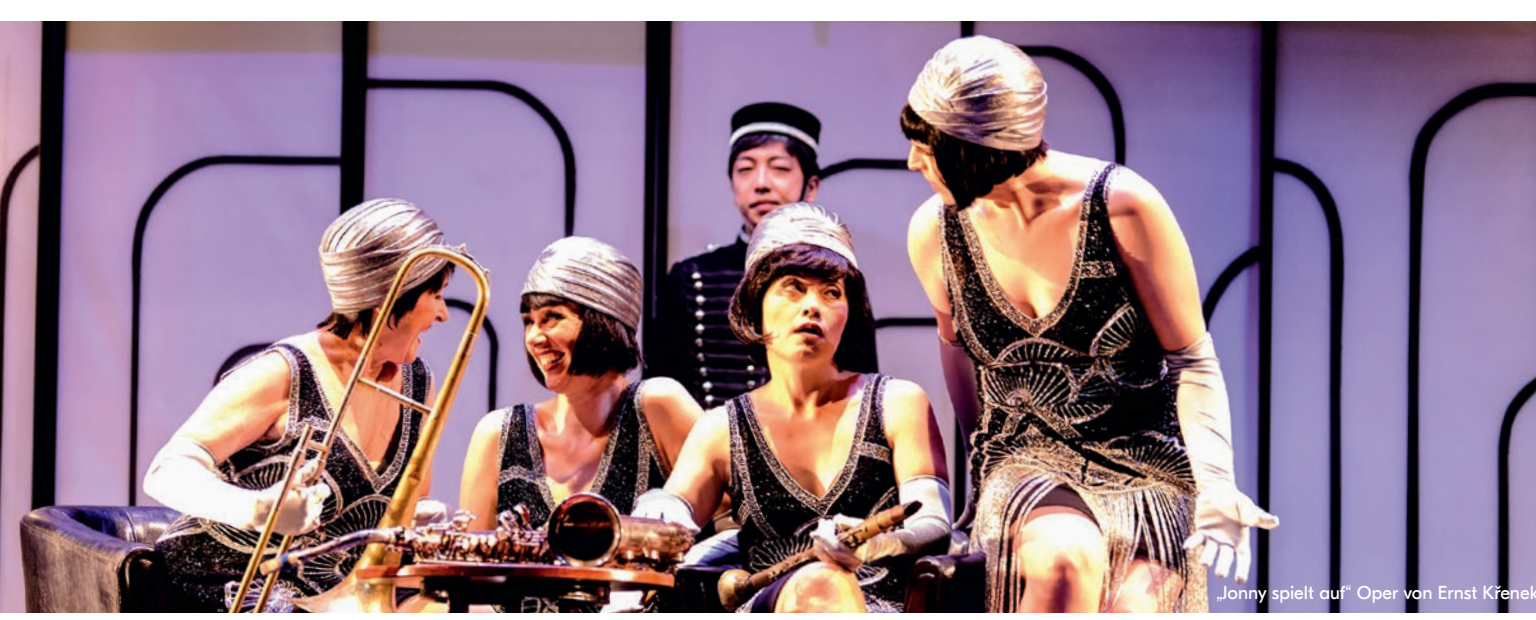
„Jonny spielt auf“ Oper von Ernst Křenek

Theaterkasse Putbus Tel. 038301 808330 Di – Fr 10 – 13 Uhr, 16 – 18 Uhr und eine Stunde vor Aufführungsbeginn Markt 13